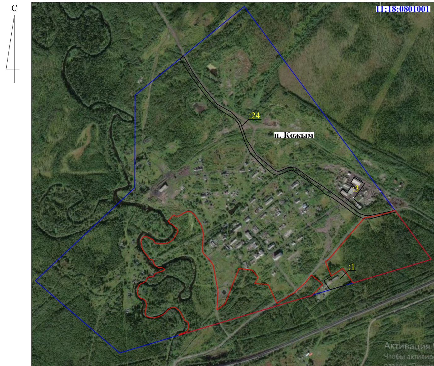
Масштаб 1: 10 000