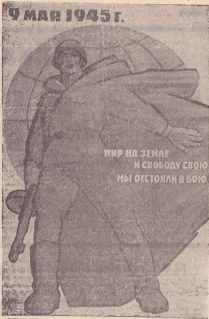
Плакат художника В. Воликова (издательство «Советский художник»).

Такая традиция у советских людей — встречать праздник трудом. Вот и сегодня горняки нашего комбината ра- ботают на Родине о том, что в честь волнующей годовщины — 50-летия со Дня победы над фашистской Германией они с 1915 года добыли 90.600 тонн топлива сверх плана. Горняки Инты одерживают все новые и новые победы на этом фронте.