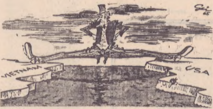
— Сколько он еще сможет проделывать этот рискованный трюк?

Такою подписью под этим рисунком дала западно-германская газета «Вестфелише рундшау», высмеивающая Соединенные Штаты Америки, которые вмешиваются в дела Вьетнама, отстояние от них на тысячи километров.