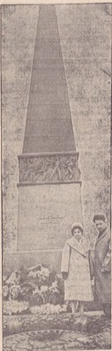
Дорогой ценой заплатил наш народ за победу в Великой Отечественной войне. Свято хранят советские люди память о погибших воинах.