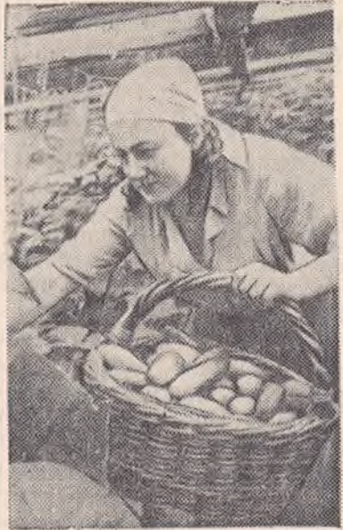
Работники совхоза „Б. Инта“ еще в апреле начали получать ранние овощи. В детские учреждения и столовые города отправлены первые десятки килограммов свежих огурцов. НА СНИМКЕ: сбор огурцов в теплице совхоза.

11—12 апреля в Ленинграде проходило совещание работников сельского хозяйства областей и автономной республики Северо-Запада. Совещание обсудило мероприятия по увеличению производства и сдачи государству сельскохозяйственных продуктов колхозами и совхозами северозападных районов страны. С докладом по этому вопросу выступил заместитель Председателя Совета Министров СССР тов. Лобанов. На совещании с большой речью выступил первый секретарь ЦК КПСС тов. Хрущев, остановившийся на неотложных задачах партийных организаций, советских и сельскохозяйственных органов, всех работников сельского хозяй-