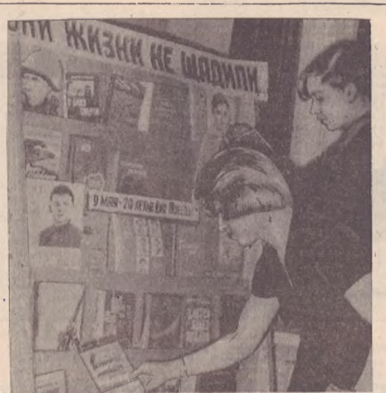
В читальном зале Центральной библиотеки оборудован стенд книг, рассказывающих о войне. У стенда всегда много посетителей. С интересом знакомятся читатели с новой литературой, рассказывающей о героической борьбе советского народа с фашистскими захватчиками. На абонементе для читателей так же подобрана специальная литература о Великой Отечественной войне. На снимке: читатели у стенда.

Отцовские, горячие ладони... Мозолистые, Мягкие, как пух, Я помню: В них держался, Как на троне. А ввысь взлетал — Захватывало дух. Они весною Землю эту грели, Сжимая плуг, Твердели, словно жезл, Они держать поводья Так умели, Что конь стихал, добрел, Какой ни есть. Я помню их, И добрых и суровых,